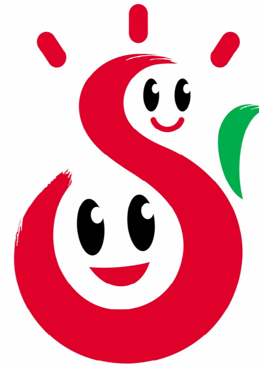
あきた家族ふれあいサンサンデーシンボルマーク