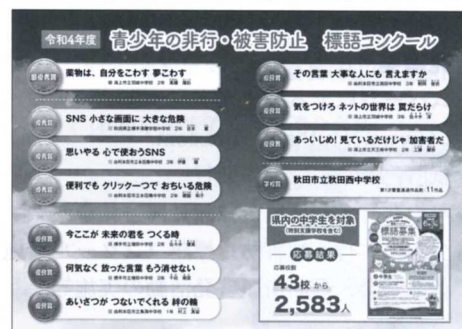
リーフレット裏面